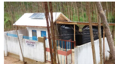
Solarbetriebene Brunnenwasser- anlage, Mayirikiti.